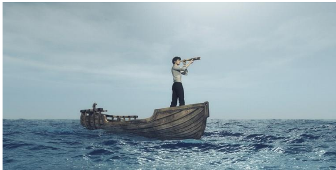
Nabij + Begrenzend