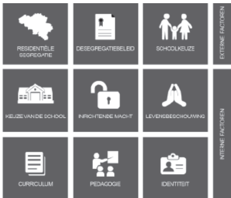
AFBEELDING 1: SCHOOLSEGREGATIE ALS EEN LAPPENDEKEN

Het fenomeen van een ongelijke spreiding van diverse groepen leerlingen over scholen is niet nieuw. De Nederlandse onderwijssocioloog Sjoerd Karsten (2003) meent zelfs dat het teruggaat tot het ontstaan van de moderne school in de negentiende eeuw. In deze